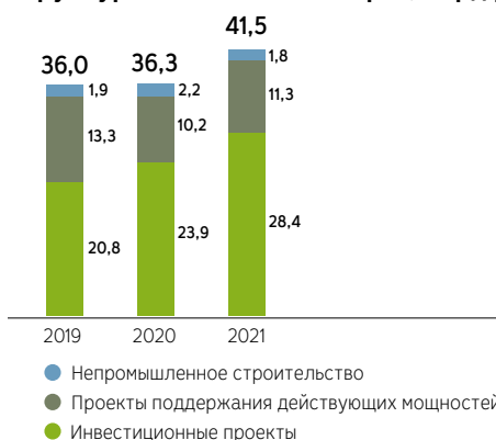
Структура капитальных затрат, млрд руб. 1

Инвестиционные проекты могут быть приняты к реализации при соблюдении условий высокого уровня доходности (IRR 20+), а также соответствия критериям наилучших доступных технологий, устойчивого развития, соблюдения целевого соотношения капитальных вложений к EBITDA и комфортного уровня ковенанты «чистый долг / EBITDA».